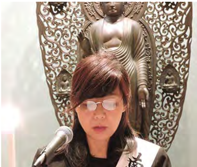
दाइसेइदोमा प्रवचन गर्दै सुङखि

१९९५ जुलाई १५मा म यहाँ कोरियाको कोसेइ काइमा आए र यो नै मेरो दोस्रो जन्मदिन भयो । “आफु परिवर्तन भए अरु पनि परिवर्तन हुन्छन्” भन्ने कुरा नै मेरो पहिलो पाठ थियो । आफु बाहेक अरु सबै परिवर्तन गर्छु भन्ने मेरो बिचार लाई कोसेइ काइको पाठले मलाई धेरै छोयो । “यहाँ अहिले आफुसँग कस्तो सबन्ध राख्ने हो भन्ने कुराले नतिजा फरक पार्न सकिन्छ” भन्ने कारण परिणम सुत्र थाहा पाउदा धेरै नै