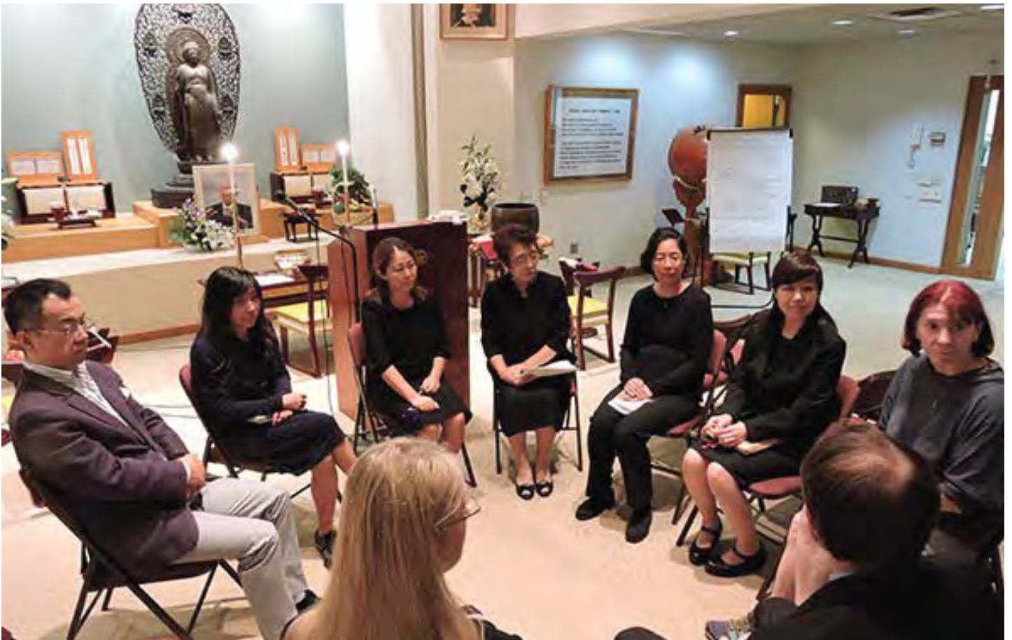
कार्यक्रममा सहभागी हुँदाको फोटो

कोरिया कोसेइ काइ अहिले ३५ वर्षको भएको छ । अहिलेको प्रमुख इजी पहिलको प्रमुखकी छोरी हुन । जापानी भाषा राम्रो बुझ्ने उहाले संस्थापक र अध्यक्षको उपदेश राम्रोसँग आरुलाई बुझाउन सकुहुन्छ तेस्को निम्ती हामी आभारी छौ । संस्थापकले बुझ्ने गरी सिकाउनु भएको उपदेश र कोसेइ काइको उपदेश कोरियाका अरुलाई बुझाइ सुखको बाटो हिड्छु भन्ने प्रण गर्दछु ।