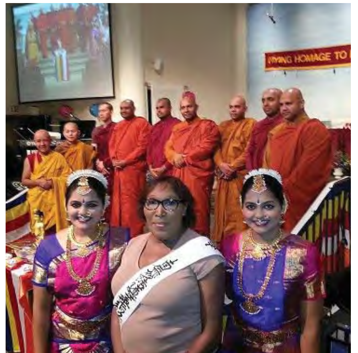
युनिटी संघको २०१५ कार्यक्रममा फेनजी सहभागी हुँदै (बिचमा)

काइको मुल्यता भनेको अरुसँग काम गरेर खुशी प्राप्त गर्ने हो भन्ने कुरा मलाई जानकारी दिन्छ । कोसेइ काइको उपदेशले मलाई केहि बर्ष अधिदेखी धेरै शान्ति दिएको छ तर यो सुरुवात मात्र हो । बुद्धले मेरोनिम्ती के के गर्ने छन भनेर हेर्न आतुर छु । म आफ्नो दुखकोनिम्ती जिम्बेवार छु यो दुखलाई मौकामा परिणत गर्ने उपदेश पनि सिकेकी छु । यो नै बुद्धको ठुलो दया हो भन्ने बुझेकी छु । बुद्धको यो दयाकोनिम्ती धेरै आभारी छु र म बुद्धले जे दिन्छन त्यो भोग्न तयार पनि छु ।