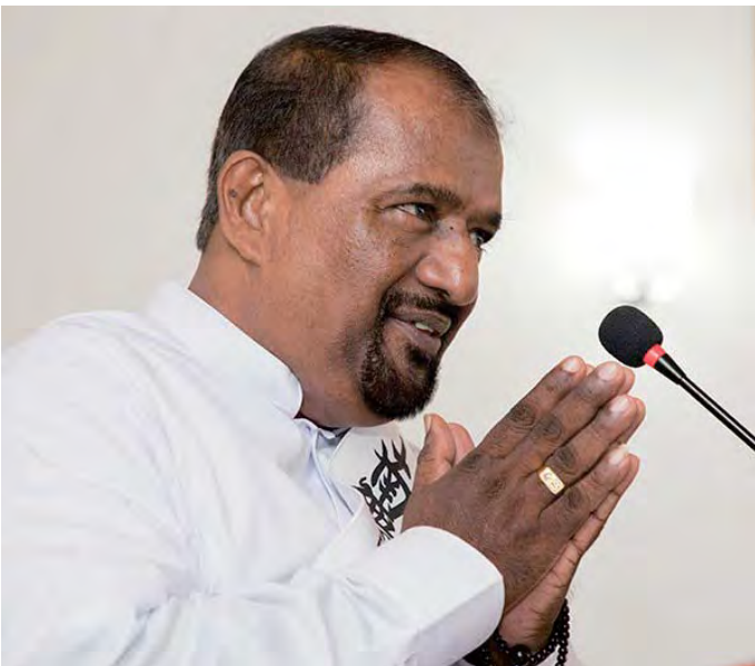
श्री लन्का मन्दिरमा प्रवचन गर्दै सुनन्दजी ।

तर १९९६को बैशाख पुर्णिमामा बिर्षन नसक्ने घटना भयो । त्यो दिन मेरो फोटो पसल आगलागि भएर सबै खरानी