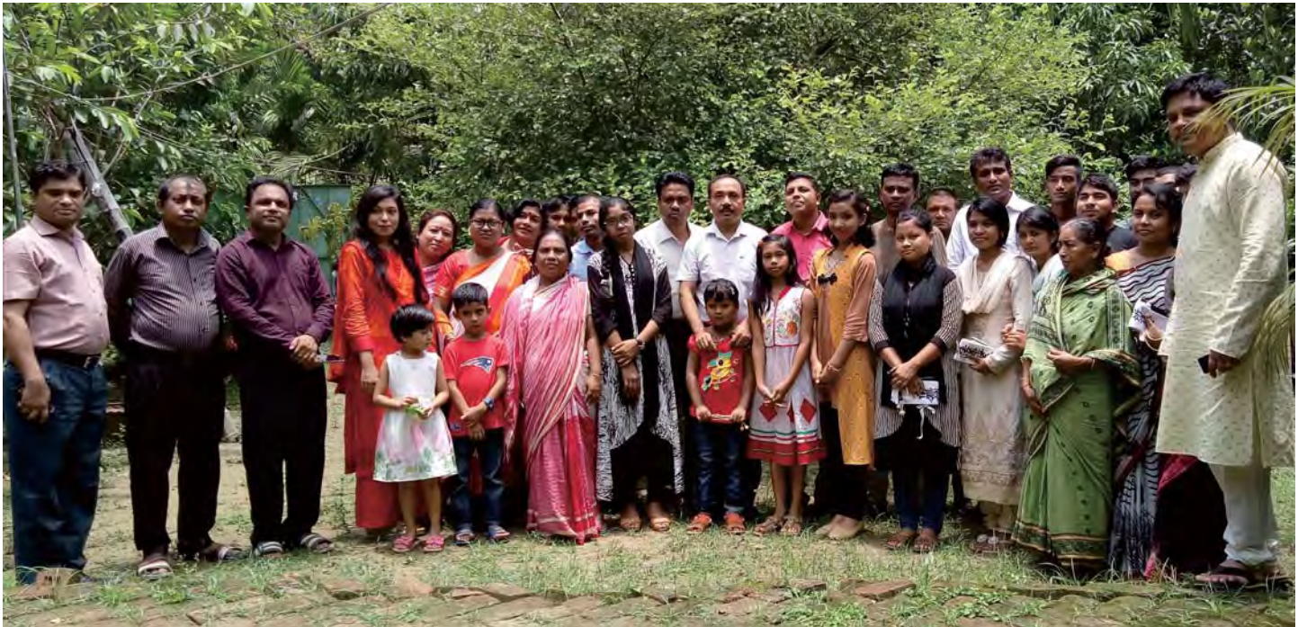
लाम संघ भवनको बगैचामा (बिचमा)