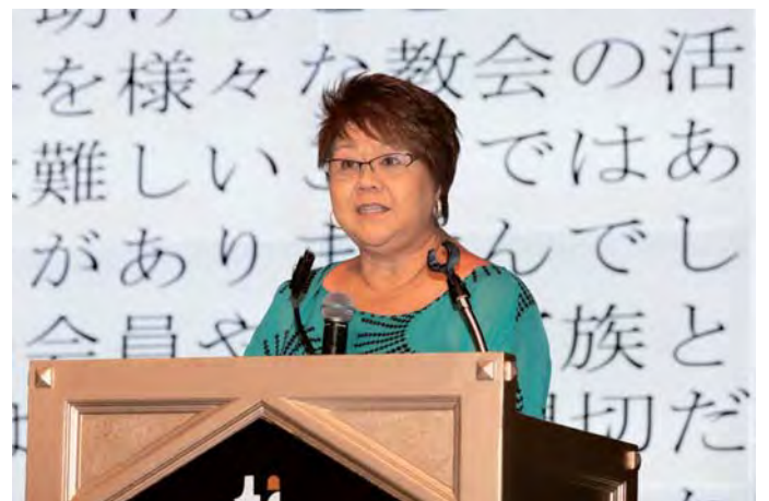
अमेरिकाको ६०औं संघ भेलामा प्रवचन गर्दै जोइसजी।

मेरो ठुलो दिदी कहिले पनि सेन्टरमा नआउने, आस्था या पुजा पनि गर्दिनथी तर उसकी छोरी ठीक थिइन। मेरो छोरी मात्र किन बिरामी? मैले भने जस्तो सबै गरे मैले किन कष्ट पाएको? मैले घर्म र बुद्ध प्रतिसत्थापान पनि गरे अनि धर्मा