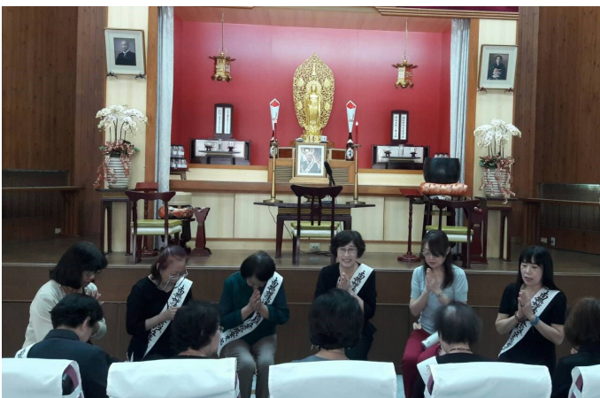
خانم جن (منتھالیه راست) در یک هوزا در ریشو کوسی - کایی تاینان شرکت می‌کند.

با دنبال کردن جای پای بنیادگذار، سوگند می‌خورم که لبخند را فراموش نخواهم کرد و همراه با اعضای دیگر خود را وقف عمل به درمه خواهم کرد. از شما بسیار متشکرم.