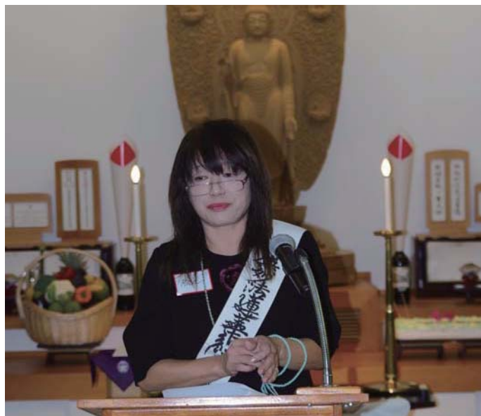
在舊金山教會說法的糟谷女士

高中畢業後，因為椎間盤突出症的接受治療一年，在家鄉住院與出入醫院的日子後，康復後順利到聖地雅歌的大學留學。雖然起初認為用英文學習是非常的困難，但是主修環境學，也順利的完成大學學業。畢業後，在日系書店得到第一份在美國的工作。