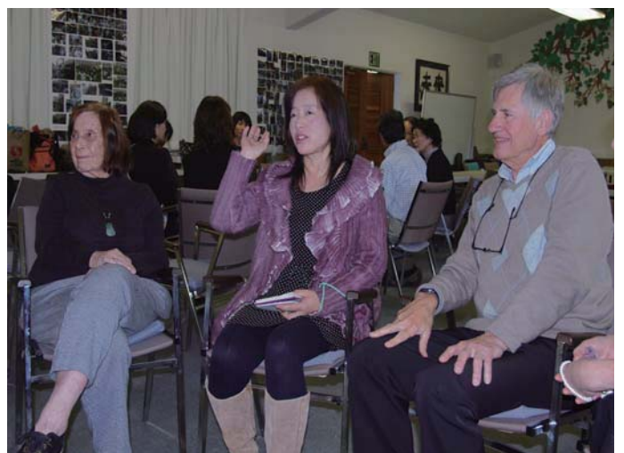
參加法座的粕谷女士（中）