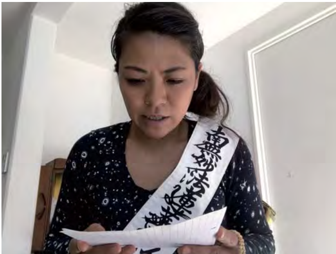
अन्लाईन प्रवचन गर्दै युक्तिकोजी ।

अहिले कोरोनाले गर्दा फ्रान्सका मानिस मात्र होईन कि संसारभरिका मानिस डर र तनावले बाचिरहेक छन । र यहाँभन्दा टाढा जापानमा भएका मेरा माइतिहरु भने यो रोगको बारेमा तेती चनाखो नभएको जस्तो लागेर तनाव हुने गर्दछ ।