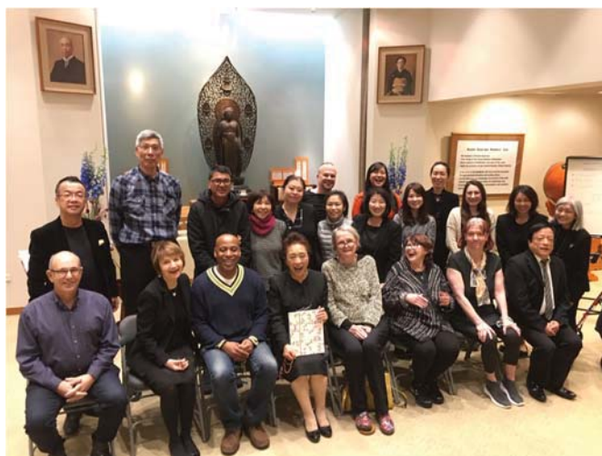
Вместе с прихожанами Ньюйоркской церкви (в верхнем ряду, четвертая слева)

Большое вам спасибо за уделенное мне сегодня внимание.