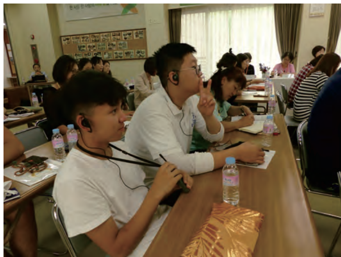
Сургалтанд оролцож байгаа нь

Анхаарал тавин сонссон та бүхэнд баярлалаа.