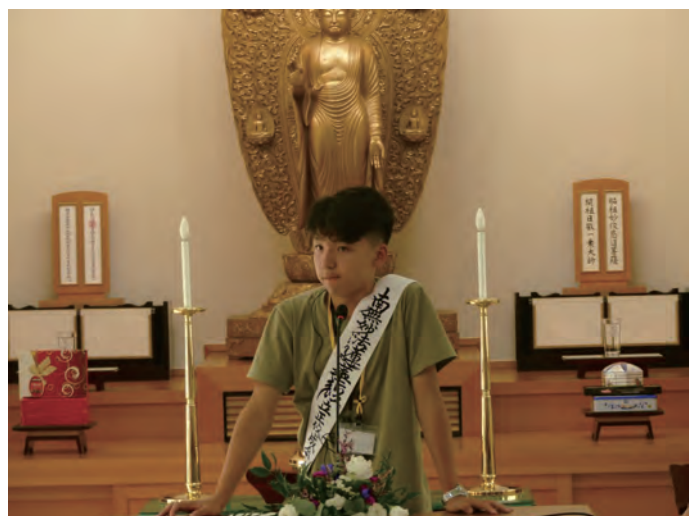
Солонгос салбар дээр илтгэл тавьж байгаа нь