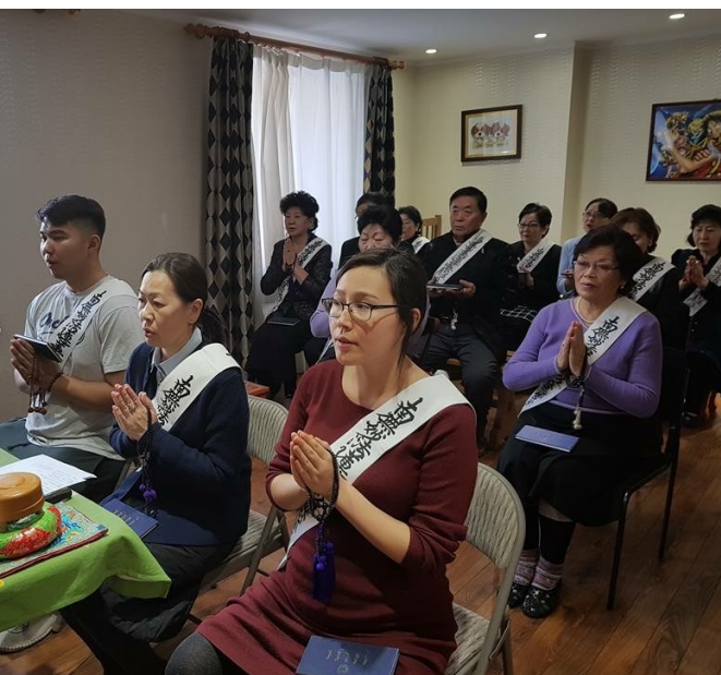
සුත්‍ර සක්කායනයේ නායකත්වය දරන අරිවුනා මහත්මිය

ධර්මයේ ආශීර්වාදයෙන් කලින්ට වඩා ආලෝකමත්ව හදවත විවර කරමින් මින් ඉදිරියටත් ධර්මය ඉගෙන ගනිමින් ප්‍රායෝගිකව කිරීමට සිතාසිටිමි. මෙම විශිෂ්ඨ ධර්ම මාර්ගය පෙන්වාදුන් සොරිගුමා ශිඛුවෝ සාන්ට හදවතින්ම ස්තූති පූර්වකවෙනවා. හැමවිටම උදවු උපකාර කරන්නාවූ සාමාජිකයන් සැමදෙනාටම හදවතින්ම ස්තූතිපූර්වක වනවා.