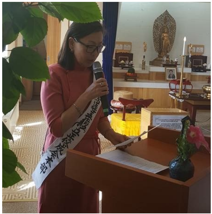
උලාන්බාතර් ශාඛාවේදී සෙප්පෝව පවත්වන අර්චනා මහත්මිය

2017 වර්ෂයේ 10 වන මස ධර්මාවාර්යය ලබාගෙන, මෙම වර්ෂයේ 5 වන මස උලාන්බාතර් ශාඛාවේ සිට කිලෝමීටර 350 ක් පමණ දුරින් තිබෙනා එල්ඩිනෙට් ශාඛාවේ