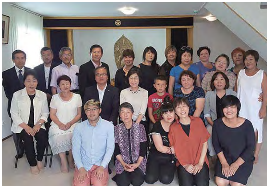
Cùng với các tăng già của trung tâm nói chuyện phật pháp Sakhalin, giáo xứ chi nhánh Hokkaido (ở giữa hàng trước)

Xin cảm ơn mọi người đã dành thời gian lắng nghe.