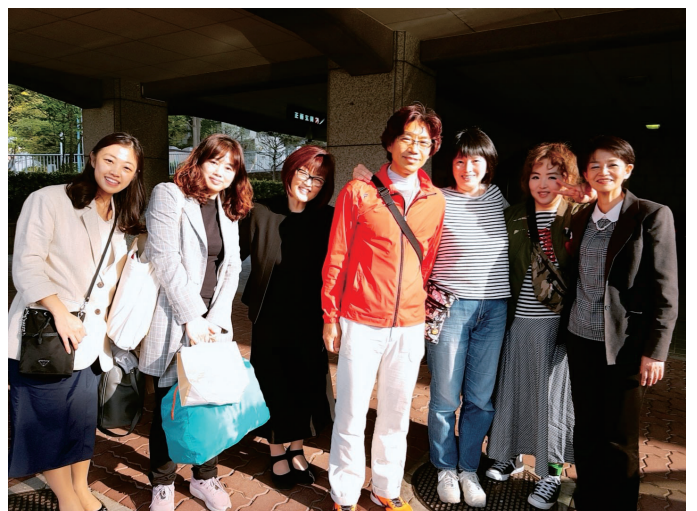
在練馬教會布教實習後、與教會的各位一同(左邊第二位)