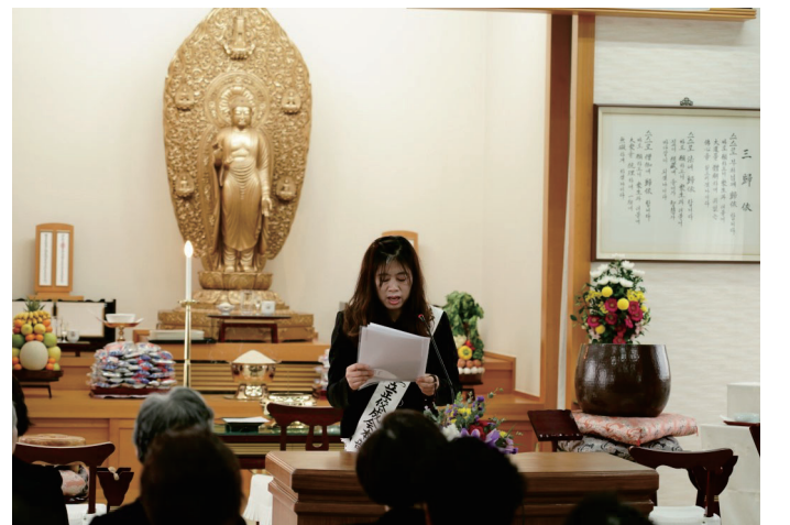
कोरिया मन्दिरमा प्रवचन गर्द ब्योनजि

हामी घर सर्दा मेरो सासु र नन्दहरुले घरमा राखेको बुद्धमुर्ती (गोहोन्जोन्) देखेर कचकच गर्न थाले । मेरो श्रीमान