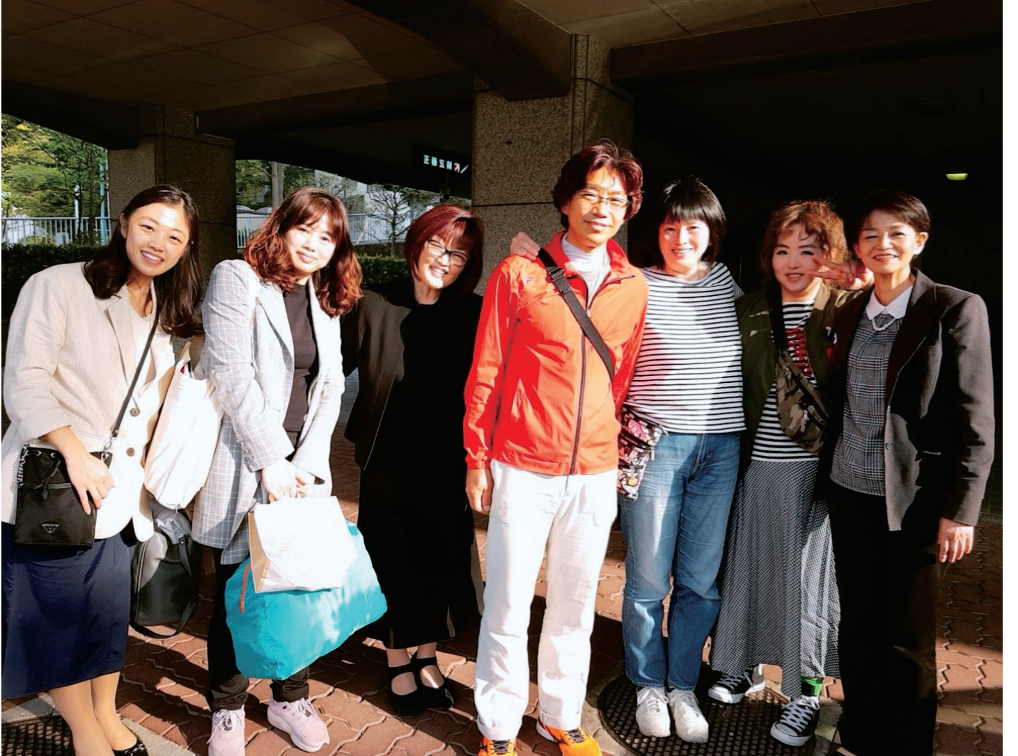
जापानको नेरिमा मन्दिरमा तालिमपछी मन्दिरका अरुसँग (देब्रेबाट दोस्रो)