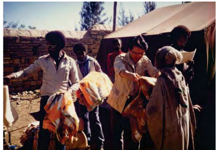
प्रथम अफ्रीकामा ब्लायांकेट वितरण अभियान

यो जाडो मौसममा कोरोनाको माहामारी चलिरहे पनि कुनै बेला न्यनो पवन लिइएर बसन्त आउनेछ र संसारभरिका मानिसको मनमा शान्ति आभारिपन प्रस्फुटन गराउने दिन धेरै टाढा छैन भन्ने विश्वास गरेको छु । गाशशो!