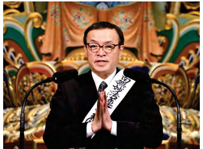
दाइसेइदोमा प्रवचन गर्दै नेमोतोजि

जिनेवामा जानुअघी संस्थापकले मलाई केहि सल्लाह दिनु भएको थियो। “संयुक्त राष्ट्र संघमा जापानबाट भाग लिने हुनाले बोधिसत्व बनेर ढुक्क भएर आफ्नो काम गर्नु। मेहेनत गरेर आफु भएको शक्ती सबै प्रयोग