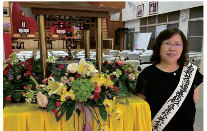
बुद्धजयन्ती पुजा पछी

पछी २०१९ को जुनमा मैले चलाएको गाडी दुर्घटना भयो । घर नजिकै देब्रे गर्छु भन्दा तेस्तो भयो । घाइतेको पहिलेदेखी नै ठुलो मानसिक र सारिरिक अपडता थियो । उसलाई धेरै गाहो भयो होला भनेको त अस्पतालमा राख्नै नपरी घर मै राखेर उपचार गरे पनि हुने भयो । मलाई पक्कै बुद्धले संरक्षण गरेका छन तेसैले एती सजिलैसँग यो समस्या समाधानतिर गयो भयो भन्ने लागेर आभारी भए । मैले सधै पुजा गर्दा ति घाइते छिटो ठीक हुन भनेर जप्न थाले । भागयबस मैले