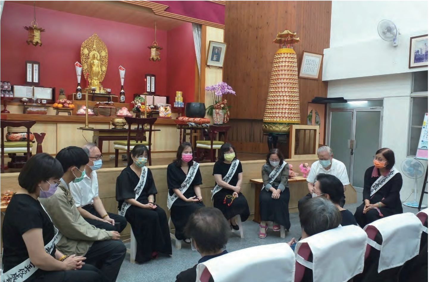
होजामा भाग लिदै चिनजी (दहिनेबाट चौथो)

अझै धेरै युवहरुलाई बुद्धसँग जोड्ने र उनिहरुलाई कोसेइ काइमा आउन भनेर मिचिबिकी गर्ने कुरामा जोडा दिने छु । र सँगइ मिलेर खुशी मनले बुद्धपथमा हिंड्ने छु भन्ने प्रण गर्दछु । धन्यवाद ।