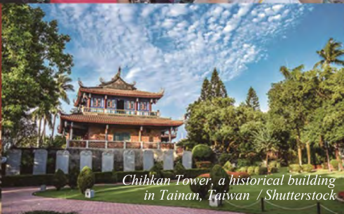
Chihkan Tower, a historical building in Tainan, Taiwan