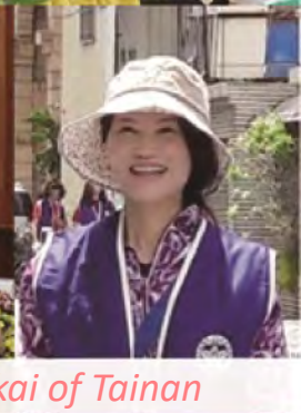
Rissho Kosei-kai of Tainan

Living the Lotus Vol. 218 (Ноември 2023)