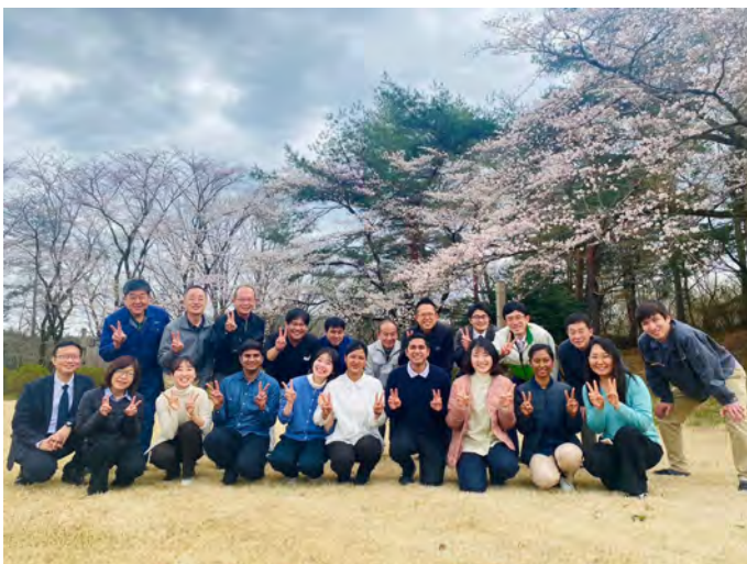
回國前和學林的各位（前排右起第4位）

另外，從10月4日開始舉行了三天兩夜的練成會，訪問了京都和奈良的其他教團進行了交流，得到了學習日本傳統宗教的機會。也參拜了一般人不能進入的古寺，非常溫馨地迎接了我們。我感覺到也是開祖恩師的和平願望和對人的溫柔超越宗派之牆而相通的證明。開祖恩師不僅是日本，透過WCRP的活動，所有的宗教都齊心協力為世界和平開拓了貢獻的道路。我感覺開祖恩師是真正的宗教指導者。現時，WCRP在世界90多個國家擁有委員會，不同宗教的人們一起致