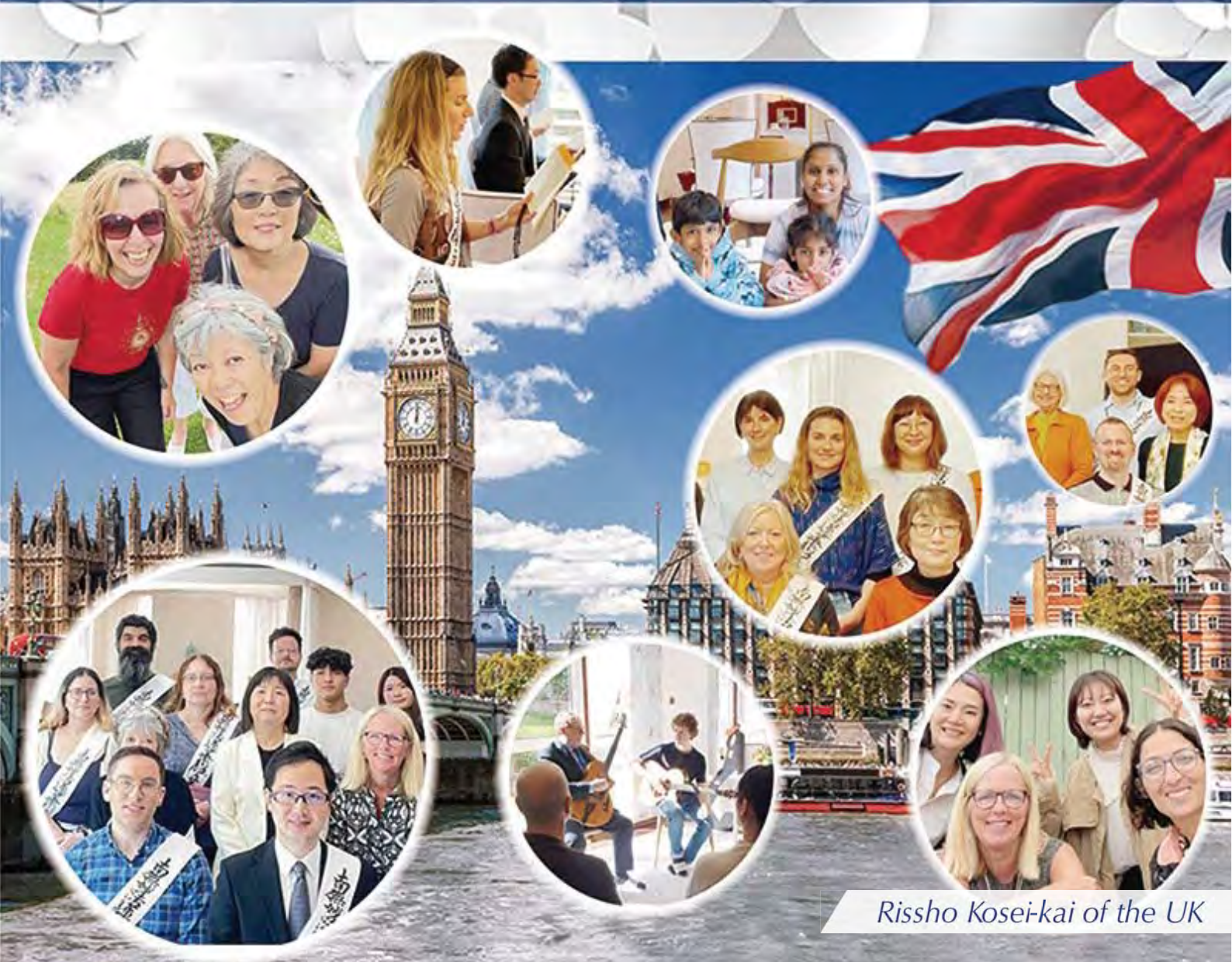
Rissho Kosei-kai of the UK