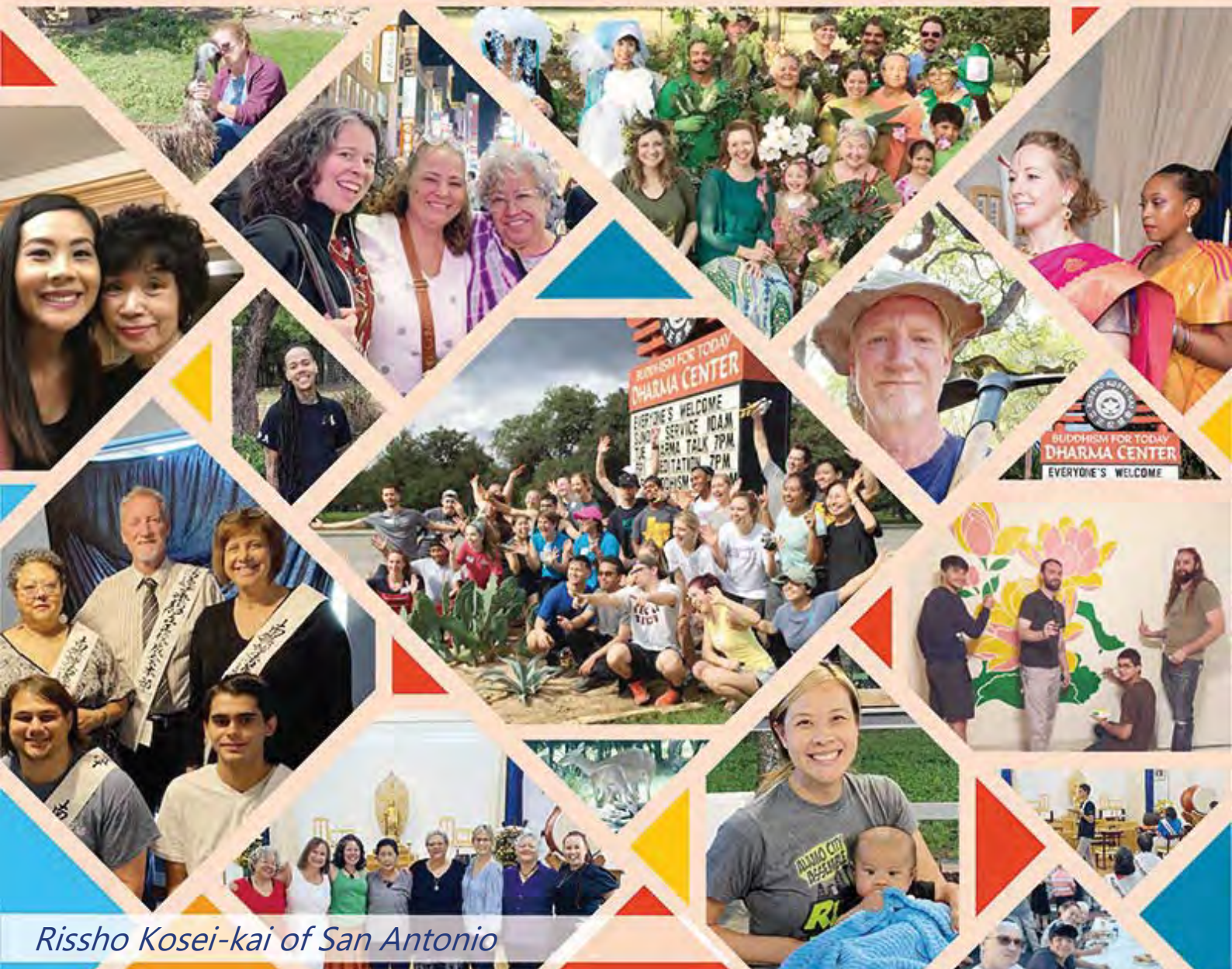
Rissho Kosei-kai of San Antonio