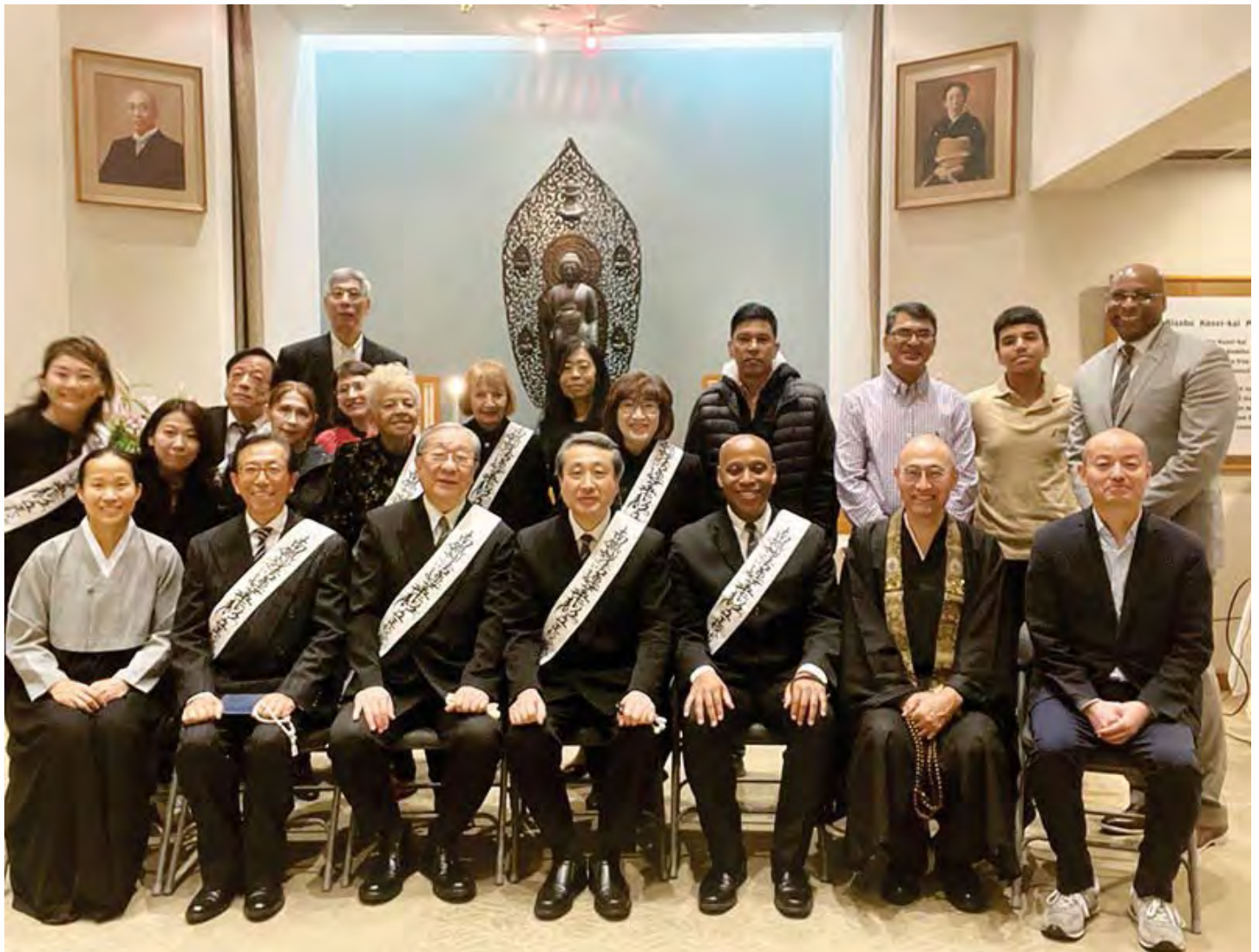
නිව්යෝර්ක් ශාඛාවේ, නව ශාඛා ප්‍රධානී ලෙස පත්වීමේ උත්සවයේදී (ඉදිරි පේළියේ දකුණු පස සිට තුන් වෙනියට)

ධර්ම ශාඛාවේ අතීත සාමාජික සාමාජිකාවන්, අපට බුදුන් වහන්සේගේ ඉගැන්වීම් මේ ආකාරයට ලබාදුන් ජපානයේ ධර්ම මිතුරන්, ඇතුළු සියලුම දෙනාට අගය කොට සලකමි. නිව්යෝර්ක් නගරාධිපති ඇඩම්ස් මහතා බලාපොරොත්තු වන පරිදි අපි ධර්ම මිතුරන් එක්ව ධර්ම ව්‍යාප්තියේ යෙදෙමින් බුදුන් වහන්සේගේ ඉගැන්වීම් තුළින් නිව්යෝර්ක් නගරයේ වෙනසක් ඇති කිරීමට බලාපොරොත්තු වනවා.