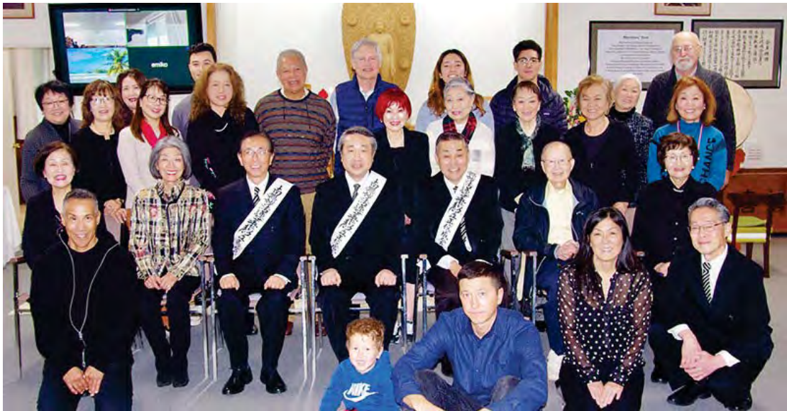
ඇමෙරිකාවේ ශාන්ත ෆ්‍රැන්සිස් ධර්ම ශාඛාවේ, නව ශාඛා ප්‍රධානී පිළිගැනීමේ උත්සවයට සහභාගී වූ අධ්‍යක්ෂක තුමා (2023/12/17)

ඒ සදහා, බෞද්ධයන් වන අපි මූලිකවම සියලු බුදුවරුන්ගේ අනුශාසනාව වන සිත පිරිසිදු කරගැනීමට (සවිත්ත පරියෝ දපනං) අවධානය යොමු කළ යුතුය. 2024 වර්ෂයේදී හදවන සංවර්ධනය කර ගනිමින්, බුදුන් වහන්සේගේ ප්‍රාර්ථනයට අනුව ජීවිතය ගත කරනවාද, ආත්මාර්ථකාමී හදවතින් යුතුව කටයුතු කරනවාද යන්න, තමාටම කතාකරමින්, සෑම මොහොතකම වෙනස්වන තම හදවතට ආමන්ත්‍රණය කරමින් පසුවිපරම් කළ යුතුයි සිතමි. බෞද්ධයෙකු ලෙස තිබිය යුතු මූලිකම දේවල් තම ගරීරයට බද්ධ කරගනිමින්, සැහැල්ලුවෙන් ඵ්දිනෙද ජීවිතය ගත කළ හැකි ආකාරයට ඔබ සියළුදෙනා සමඟින් ආධ්‍යාත්මික දියුණුව ඇතිකර ගැනීමට සිතමි. මේ වසරේදීත් ඒ වෙනුවෙන් ඔබ සියළුදෙනා සමඟ සහයෝගයෙන් ලබාදෙන්න.