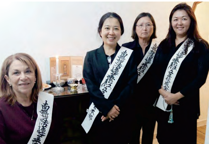
ब्राजिलका सदस्यको घरमा संघका साथ

साथमा गाकुरिनका विद्यार्थीसँगको अन्तर्कृया पनि ज्यादै महत्वपूर्ण थियो तेसैले गर्दा मलाई बुद्धधर्म र पुण्डरिक सुत्र अझ पढ्न मन लाग्यो । र एक बर्षपछी १९९५मा म पनि गाकुरिनमा भर्ना भए । त्यहाँ पढ्दा कहिलेकाही साथिहरूसँग खटपट पनि भएको थियो । तर तेस्ता अनुभवले गर्दा “कर्मले गर्दा अफु बुझ्ने तपस्या हो” भन्ने कुरा बुझे तेसैले त्यहाँको ३ बर्ष पुण्डरिक सुत्रलाई अझै माइने र आफ्नो मन बुझ्ने आफ्नो गराइ सोचाइलाई हेर्ने “आत्म समिक्षा” र “बुझाइ” को समय थियो जस्तो लाग्छ ।