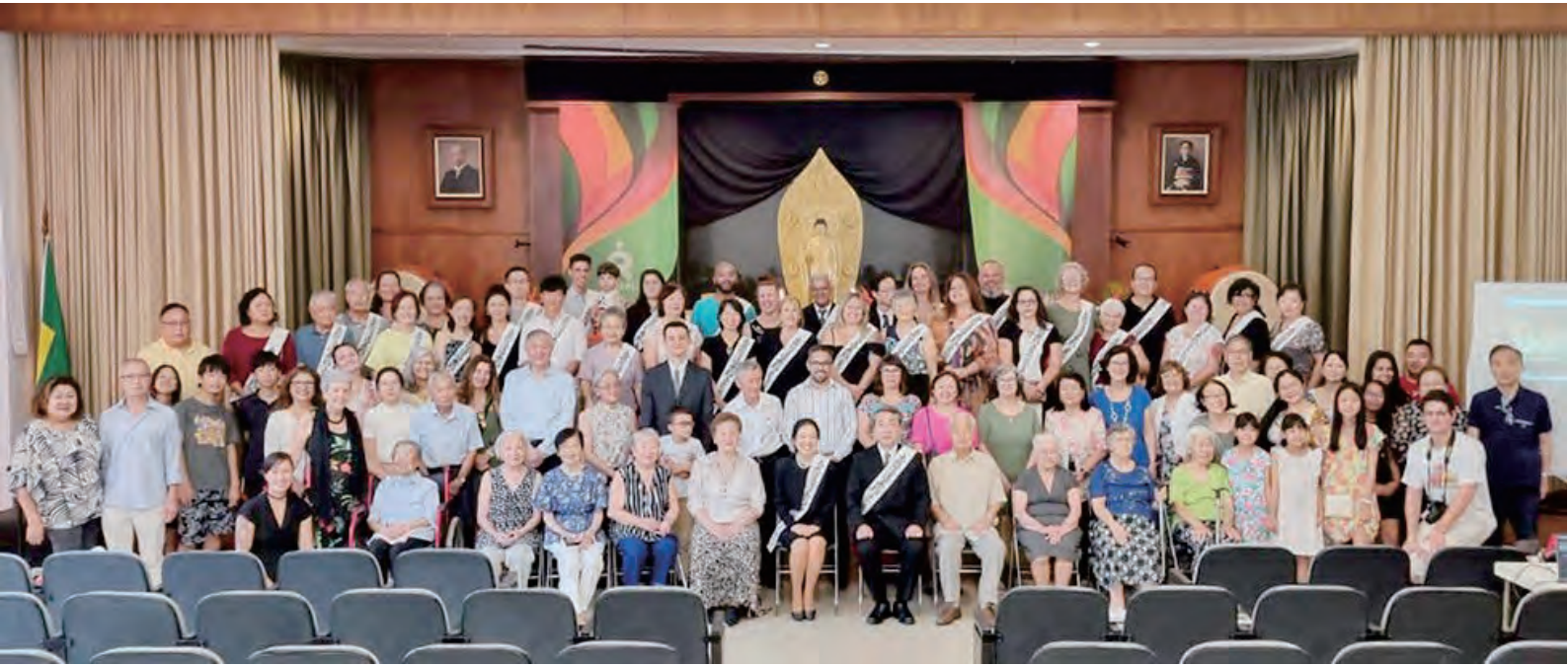
ब्राजिल मन्दिर प्रमुख सपथ समाहरोहपछी सदस्यहरुसँग (सबैभन्दा अघी बिचमा)

अब सकेसम्म धेरै युवालाई जापानको गाकुरिन बिद्यालय पठाएर अर्को पुस्ताका उत्तरधिकार बनाउन मानव श्रोत बिकाशमा सर्बशक्ती खर्च गर्छु भन्ने छ । र हामीले सपना देखेको पोर्चुगी भाषामा “पुण्डरिक सुत्र तृभाग” को अनुबादन पुर्ण हुँदै छ । यो नै ब्राजिलमा प्रचारको नयाँ आधार भन्ने छ र धेरैको सुखको लागि यो मन्दिरका सबै एक भएर प्रचारलाई गती दिएर ब्राजिल भरी उपदेशको फुल फुलाउने मन छ । र यो नै मेरो सपना हो ।