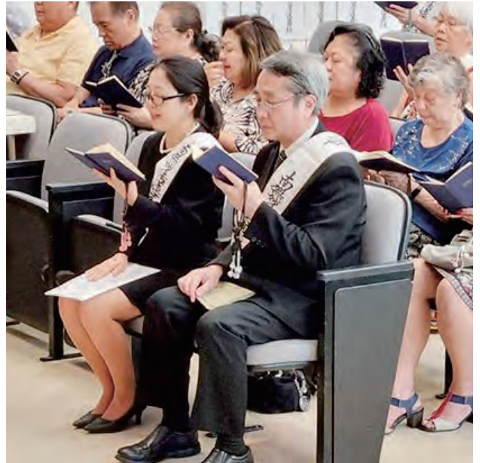
ब्राजिल मन्दिर प्रमुख सपथ समाहरोहमा सुत्र पाठ गर्दै