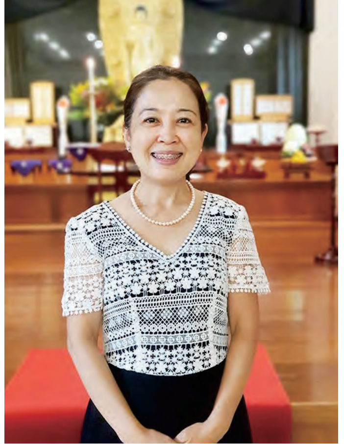
ब्राजिल धर्म सेन्टर स्थापनाको ५० बर्ष मनाउदा दोजोमा

मेरो हजुआमा कोसेइ काइको सदस्य भएकोले म तेस्रो पुस्ताकी हु । बुवा १९५८मा कोसेइ बिद्यालय सकेर तुरुन्तै ब्राजिल आउनु भएको थियो तेही बर्ष संस्थापक निवानो जापानि अप्रवासी ५० बर्ष उत्सवमा आएर बुवाको काम गर्ने ठाउँ जानु भएको रहेछ । म जन्मनुअघी तेस्तो अदभुत कुरा भएको र मैल अहिले यो जिम्मेबारी (म ब्राजिल मन्दिरको मिनिस्टर हुन यहाँ जन्मेकी हु कि भन्ने) पाएको छु र मेरो प्राणलाई यहाँसम्म जोडिदिने हजुरआमा मेरो बुवाआमा अनि संस्थापक, अध्यक्षको उपदेश सिक्न पाएकोमा फेरी पनि आभारी छु र ब्राजिलमा मेहेनत गरेर यो उपदेश फैलाउनेछु भन्ने आफ्नो कर्म र जिम्मेबारी महसुस गरेकी छु ।