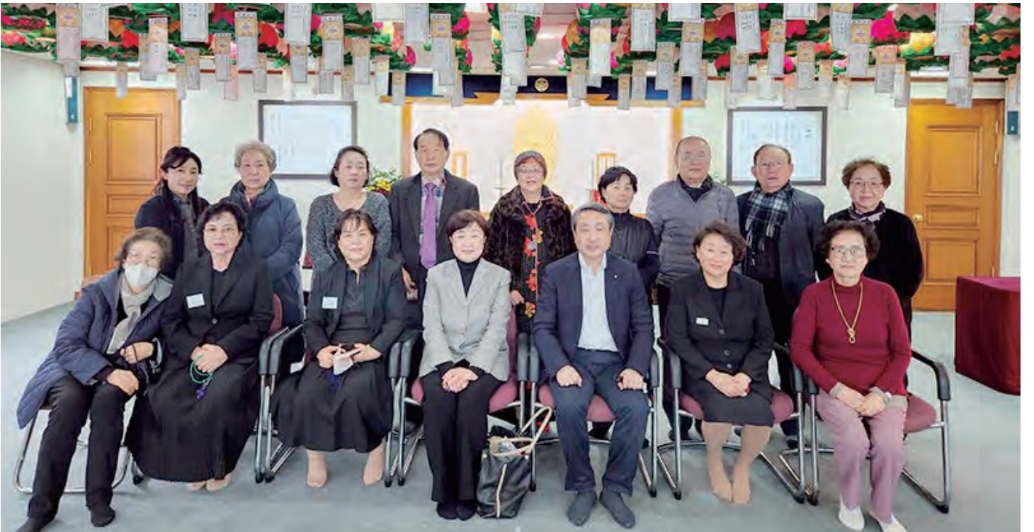
रेव आकागावा २०२४ डिसेम्बर १०मा कोरिया मन्दिर बूसान शाखामा अन्तर्कृत्य कार्यक्रममा भाग लिदै (अघी दहिनेबाट तेस्रो)

यो महिनाको अध्यक्षको प्रवचनमा नयाँ बर्षको प्रवचनमा भनिएको “श्रद्धा र बिनम्रता” मध्य “बिनम्रता” को बारेमा भन्नुभयो । अध्यक्षले ४ दशकदेखी भनिआउनु भएको मन मलिलो गरी बोद्धिसत्व रोप्ने कुरा हो र यो बर्ष पनि हरेक महिना प्रवचन यो कुरा सामेल गरी अझ बिस्तृतरूपमा एसको अर्थ र अभ्यास गर्ने तरिका सिकाउनु हुन्छ भन्ने आशा गरेको छु । वहाँले “बिनम्रता” भने बुद्धत्व जस्तै हामी सबैमा हुने कुरा हो भनेर सिकाउनु भयो । यो बर्ष तेस्लाई म बिनम्र भएर मनन गरी पुण्डरिक सुत्रमा अझ समर्पित हुनेछु ।