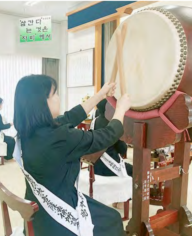
मन्दिरको पुजामा ढोलक बजाउँदै छेजि

अहिले मेरो दुइ मिल्ने साथी छन र ति मध्य एक म २०२२मा मन्दिर फेरी आउन सुरु गर्दा उनिले नै मलाई जाडोयाम ध्यानमा निम्तो दिइन । तिनिले गर्दा म उनिसँग सेप्टेम्बरको फ्रेम गरिएको गोहोन्जोनलाई मन्दिरमा लग्न सक्यौ । अर्कोतिर मेरी अर्की साथिलाई ब्याड्मिन्टन खेलदा भेटेकी हु । उनिलाई यहाँ मिचिबिकी गर्छु भनेर उनिलाई मन्दिरमा निम्तो दिए । तर मैले उनिलाई सदस्य बन्न कर गरेको जस्तो भएर होला उनिलाई असजिलो लागेको नबुझेर अनि बिस्तारै मन्दिर आउन छोडिन । तर अहिले सोच्दा मैले गल्ती गरेछु जस्तो