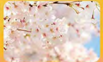
Rishso Kosei-kai of Seattle