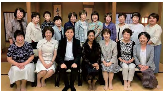
포교실습중, 후쿠이 교회에서 회원 여러분들과 함께

그러나, 잘 생각해보면 제가 지금 가장 바라고 있는 것은 굉장히 어렵다고 하는 일본어 능력시험 1급에 도전하여 합격을 목표로 하는 것입니다. 그것은 정말로 어려워, 오르기 힘든 길이라고 생각합니다만, 저는 절대 포기하지 않을 것입니다. 귀국 후에는 우선 필사적으로 제 자신의 일본어 능력을 높이기 위해서 공부하여, 가능하다면 입정교성회에 봉직하여 더욱더 깊이 가르침을 배우고, 장래에는 국제전도나 국제 종교협력에 도움이 되고 싶습니다.