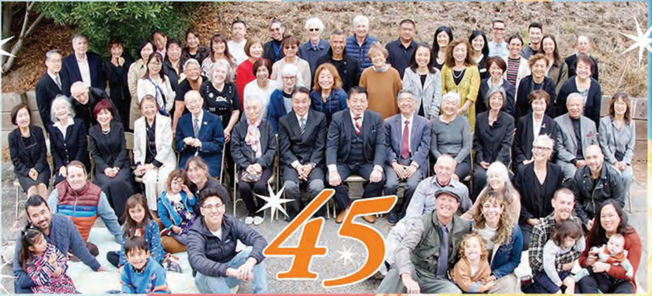
Risho Kosei-kai of San Francisco Celebrated Its 45th Anniversary on September 15