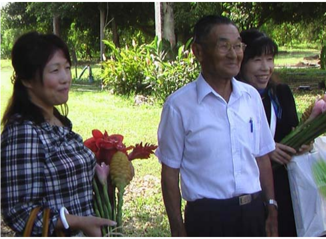
【ภาพ】 คุณมโรวีผู้คอยดูแลสถานที่เมื่อได้เจอกับคุณมาการะและ