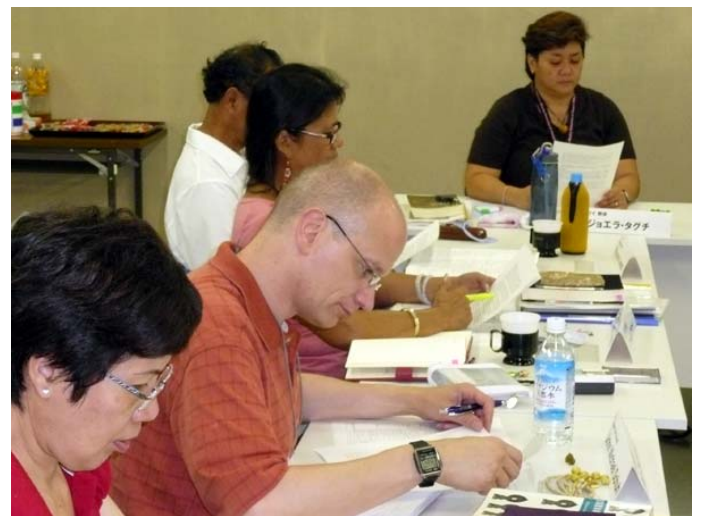
參加本部主辦的幹部教育時的休先生（左起第二位）