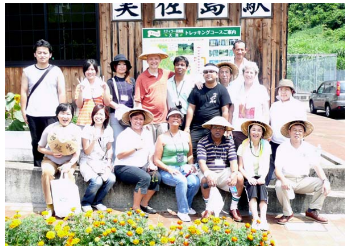
與海外據點的會員在一起（後排中央身穿橘色T恤）