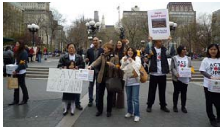
Нью Йорк нийгэмлэг, Лаёнс клубээс зохион байгуулсан хандив цуглуулах үйл ажиллагаанд оролцов

Дэмжлэг туслалцаа үзүүлсэн гадаадын гишүүд та бүхэндээ баярлалаа.