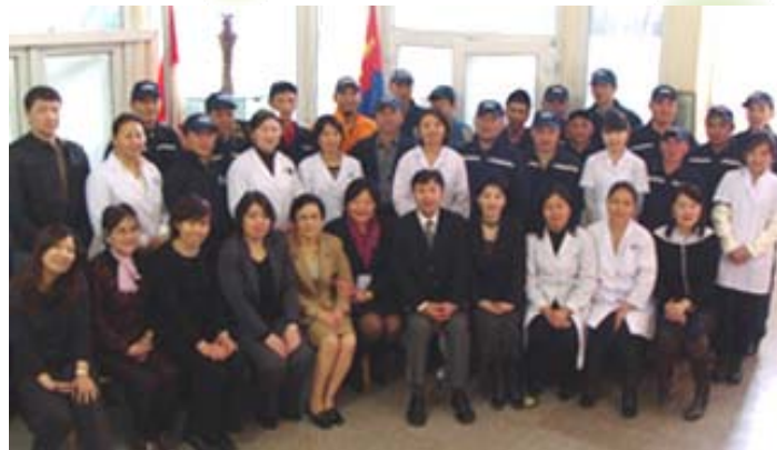
Монгол нийгэмлэг, хандив цуглуулах үйл ажиллагааны дараа

Энэ 1 жилийн хугацаанд гамшигт өртсөн бүсийн хөгжлийн төлөө зориулсан та бүхний энэрэнгүй сэтгэл бол Цагаан Лянхуа судар, Үүсгэн байгуулагчийн сургаалын мөн чанар, түүнчлэн бодисадвагийн үйл тэр чигээрээ юм. Та бүхний дүр төрх гадаадын гишүүд бидний сэтгэлийг хөдөлгөж, зоригжуулж, бидэнд үлгэр дуурайл болсон. Та бүхний цаашдын хичээл зүтгэл гамшигт өртсөн бүс нутгийг сэргээж, хүсэл мөрөөдлийг өгөх болтугай .