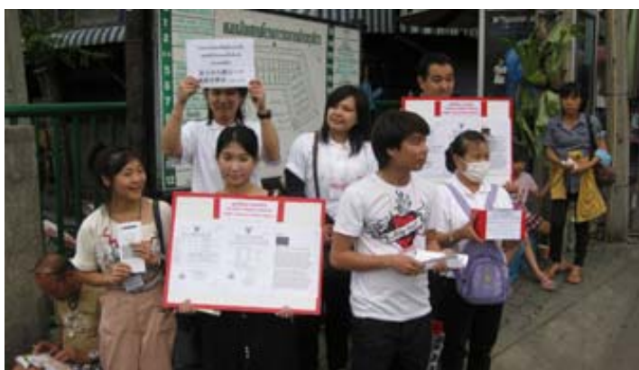
Бангкок нийгэмлэг, хандив цуглуулах үйл ажиллагаа

Бид бүхэн та бүгдийг үргэлж бодож үргэлж хамт байдаг шүү. Бидний сэтгэлээ чанга барьж, амар амгалан, энэрэнгүй байх юм бол давж туулж чадахгүй зүйл гэж байхгүй.