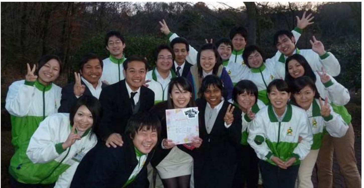
Эхний эгнээний баруун талаасаа 4 дахь нь Вантэра болно