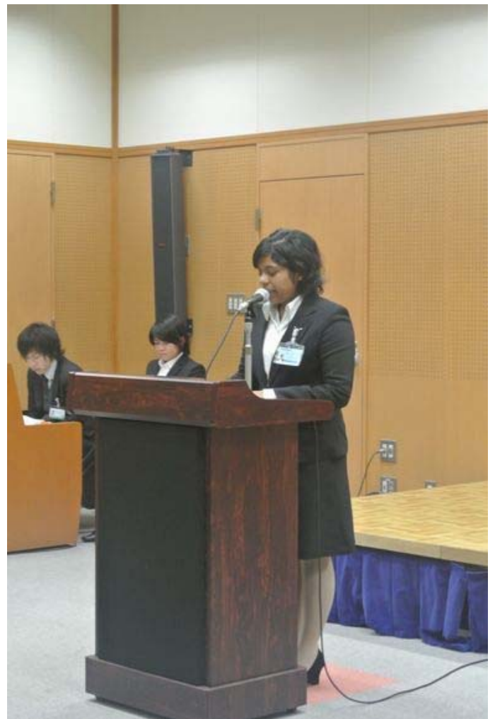
Төгсөгчдийн бие даалтын ажлаа хамгаалах сименарын байдал

Нийгэмлэгийн дадлагын үеэр өөр нэг сайхан учирал байсан. Тэр бол 30 настай нэгэн эмэгтэйтэй учирсан явдал байлаа. Тэр эмэгтэй өвчний улмаас гэрээсээ бараг гардаггүй байв. Мөн бурхан гэх мэт хийсвэр зүйлд итгэдэггүй хүн байв. Би тэр эмэгтэйтэй “Үүсгэн байгуулагчийн сургаалтай учраасай, нийгэмлэг дээр ирээсэй” гэж хүсэж байлаа. Нэг удаа тэр эмэгтэйтэй нийгэмлэг дээр очно гэж хэлсэн боловч, утсаар “Эрч хүч, зориг хүрэхгүй байна. Маргааш очиж чадахгүй нь ээ, уучлаарай” гэж хэлээд ирж чадахгүй болчихов.