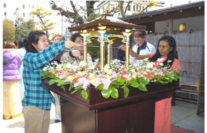
Чихэртэй цай (Ама-Ча)-ны өргөл

гадаад хүн оролцож байсантай харьцуулбал өдгөө 400 орчим хүмүүс цугладаг болтлоо өргөжөөд байна. Энүү баяр нь цаашид ч улс үндэстэн хамааралгүй олон хүнийг бурхан багшийн сургаалтай учруулах боломж өгөх баяр байгаасай хэмээн хүсэж байна.