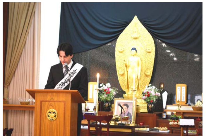
Илтгэл тавьж байгаа байдал

Бурхан багш, үүсгэн байгуулагч танд баярлалаа. РКК нийгэмлэгийн ерөнхийлөгч танд байрлалаа. Та бүхэнд баярлалаа.