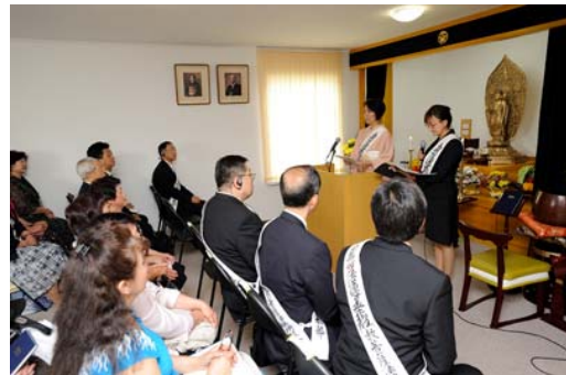
Ирээдүйн ерөнхийлөгч Коошо Сахалин салбарын шинэ сүмийн нээлтийн ёслол дээр

Энэхүү бурхан нь Орос улсад залагдаж буй анхны бурхан бөгөөд олон хүн энэхүү салбарт цугларч, бурханы сургаалыг даган аз жаргалтай болохыг хүсэн ерөөе.