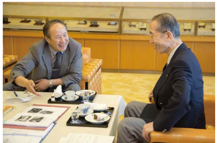
Sr. Deleg, encontrando-se com o Mestre Presidente (à esquerda).

A publicação do livro na língua mongol está prevista para o dia 15 de novembro, data comemorativa do nascimento do Mestre Fundador Niwano.