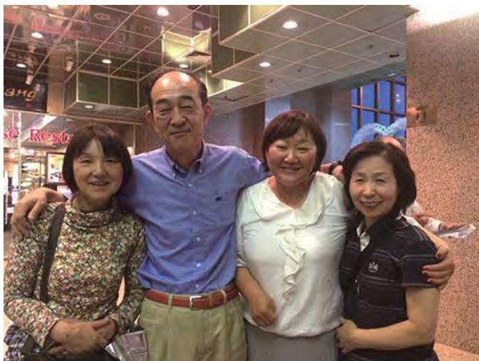
از چپ، خانم ناگومو و شوهرش، خانم زوریگما شوگر، و یک عضو مرکز درمّه‌ی شیبویا

هفتاد سال پیش، یک مکاشفه‌ی الاهی اعلام کرد: «روح سوره‌ی نیلوفر از ریشو کوسی - کایی به تمام جهان گسترش خواهد یافت.» همان‌طور که اعلام شد، آموزه‌ها واقعاً در جهان در حال گسترش‌اند. من سوگند می‌خورم که خودم را به سختی تربیت کنم، با دیگران با مهربانی برخورد کنم و خودم را وقف رسالت درمّه‌ی من تا چنان که درمّه‌ی من می‌آموزد بتوانم به منظور رسیدن به یک جهان آرام قدم بردارم. امروز از همگی بسیار متشکرم.