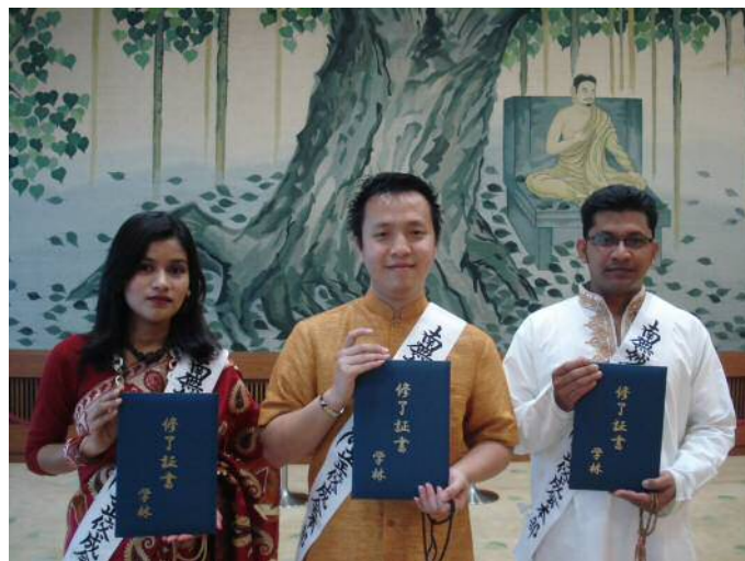
跟烏蘭巴托支部會員一起去Tedor (中央)

有一天和支部長們一同去OMICHIBIKI。那天去的那戶人家以前有來過教會，但還不是會員，支部長們邀請過很多次但是對方總是說「不想成為會員」。細問理由才知道原來，對方的妹妹和弟妹因為加入其他的宗教，也是常常要他加入，但是他沒有加入。因此他也不想加入佼成會。見到對方的時候我嚇了一跳，因為在第一回布教實習的時候，我在教會裡面和他說過一次話。支部長跟我說：「妳這是一個機