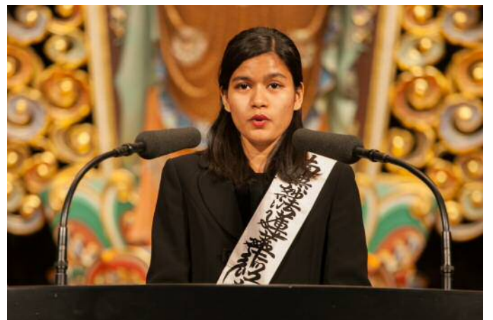
Moitri小姐於大聖堂發表說法

為了能夠合格，每天都很努力學習，然後參加考試。考試結果的通知一直要到二月，在那之