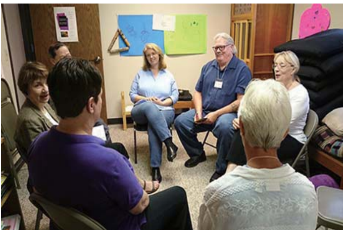
參加全美英文幹部研究班

所幸，我的出席率又慢慢開始增加。在2012年10月，他們問我要不要參加奧克拉荷馬教會正新興推行的「監獄推廣計劃」。我爽快的答應了。從那時開始