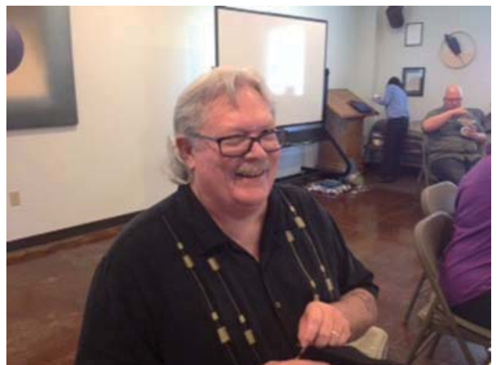
在於俄克拉荷馬教會

1993年我父親給了我一份貨運業務的工作。這份工作讓我很有滿足感。1998年我的父親退休後，我也當上了營運經理。在2003年，我的酗酒的問題已經達到極點了。那時，我的太太向我發出「是要結束酗酒的習性，還是要結束我們婚姻」的最後通牒。這樣回首一看，自己在酗酒下生活也有28年之久。在我的內心深處，我知道我需要幫忙。我有曾嘗試過戒酒幾個月，但是終究還是回歸到戒不了。我常常會將自己與家人脫離，一個人獨自、孤單的喝酒。我將我酗酒的