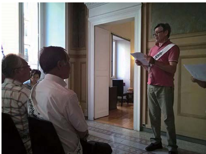
آقای سالواتوره تجربه‌ی معنوی‌اش را در مراسمی در طی برنامه‌ی تبادل اعضا با دیگران سهیم می‌شود که توسط بخش‌های توکیو غربی و تاما و ریشو کوسی - کایی در رم برگزار شد.

در ریشو کوسی - کایی می‌توانستم خاستگاه‌های آیین بودا را بدون هیچ اضافات نالازمی مشاهده کنم. پیام مستقیم بودا را بدون