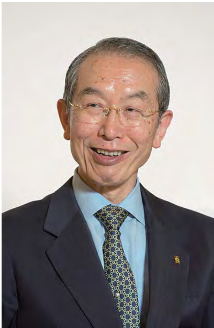
අපට පහැදිලි කර දෙන්නාවූ මෙම සත්‍ය අප ස්වභාවයෙන්ම මනෝමය ශක්තියෙන් අවබෝධ කර ගෙන සිටියි. එය විද්‍යාවෙන් සාක්ෂි දරන්නේය.

බුදු දහමේ සදහන්, 'සෑම සියළුදෙනෙක් තුලම බුද්ධ අංකුරයක් ගැබ් වී ඇත', 'සෑම සියළුදෙනෙක්ම විමුක්තිය ලබාගත හැකිය' ආදී එකිනෙකට තිබෙන්නාවූ අන්තර් සහයෝගය හා සියළුදෙනෙහි තිබෙන්නාවූ සබඳතාව තුළින් පෙර සදහන් කළ විද්‍යාත්මක දැනුම බුදුවදන් හා පුරෝකථකයන්ගේ වදන් අනුමත කිරීමකි. නූතන විද්‍යාවට අනුව