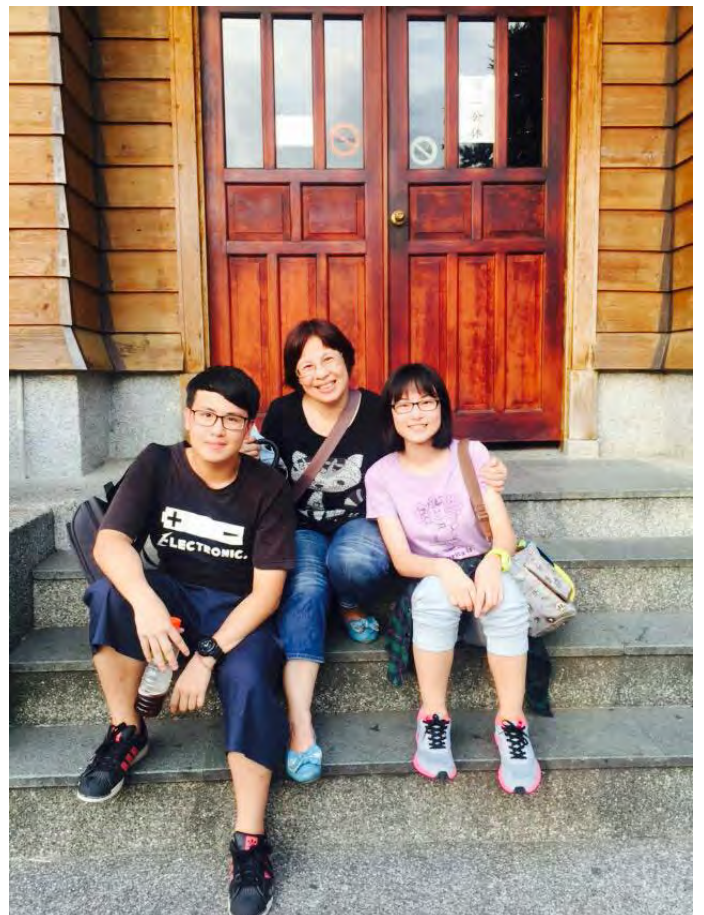
陳小姐（中央）與她的孩子。