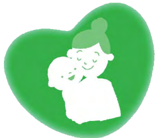
පිලිතුරු සැපයීම , තෝකියෝ පවුල් අධ්‍යාපන හා පර්යේෂණ ආයතනය

'ඇදුම් මාරු කරන්නේ කියදද?' 'සෙල්ලම් කරන්නේ කියදද?' යනුවෙන් නිතරම දරුවාගෙන් විමසා සිටීම වැදගත් වේ. දරුවන් යනු නිතරම උත්සහයෙන් කටයුතු කළ හැකි අයුරින් උපත ලබා ඇත.