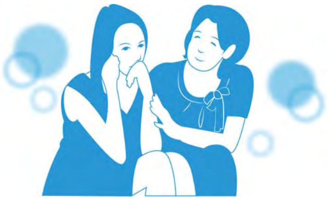
පිලිතුරු සැපයීම , තෝකියෝ පවුල් අධ්‍යාපන හා පර්යේෂණ ආයතනය

හැකිනම් උපදේශන සේවයක සහයද ලබාගෙන , පුරුෂයාගේ දෙමව්පියන්ගේද සහයෙන් හැකි ඉක්මණින් ඔහුට ප්‍රකෘති තත්වයට පත්වීමට හැකි වන ලෙස ඔබ දෙදෙනාම ප්‍රාර්ථනා කළ යුතුයි යැයි සිතමි. කාලය ගත වන නමුදු , මෙම ප්‍රශ්නය තුලින් දෙපාර්ශවයම යථාඅවබෝධයෙන් නිවැරදිව පිවිතය හැකි ගස්වා ගැනීම , එම ගැටළුවේ නිසි විසඳුම බවට පත්වේ.