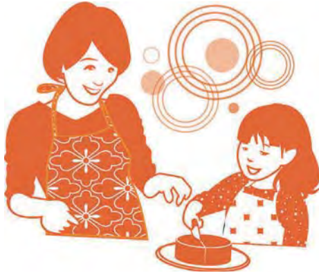
පිලිතුරු සැපයීම , තෝකියෝ පවුල් අධ්‍යාපන හා පර්යේෂණ ආයතනය

ඔබ දිගින් දිගටම මෙලෙස කටයුතු කිරීමට උත්සහ කළහොත් අනිවාර්යයෙන්ම දරුවන් දෙදෙනාම ' සුරතල් ' ලෙස හැඟෙන තත්වයට පත් වේ යැයි සිතමි.