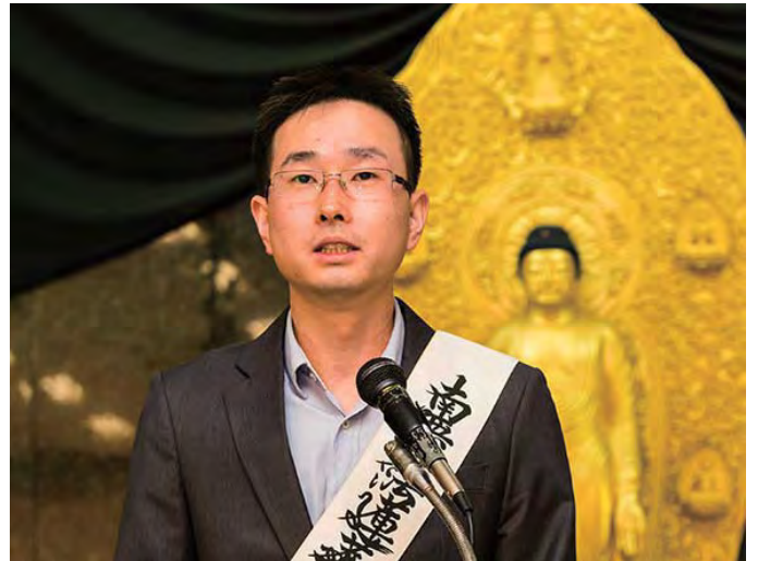
在巴西教會創立45週年紀念大典上說法

更糟糕的是，我父親租借的屋子的房東突然告訴他們，要把屋子收回去做生意，要我父親他們立刻搬出去。父親不得不急匆匆地尋找新的地方。