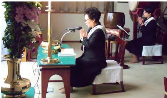
成為主任後認真擔任導師的樣子

大會團參。在那裡我們受到了大家發自內心的熱情接待，與來自諸國的會員們超越國際，加深了彼此作為並肩走在同一教義之路的僧伽間溫暖的交流。這是一次非常令人感激終身難忘的經驗。今後我也要把這個精妙的教義傳達給更多的人們，為了能夠共同獲得幸福而努力精進。謝謝大家。