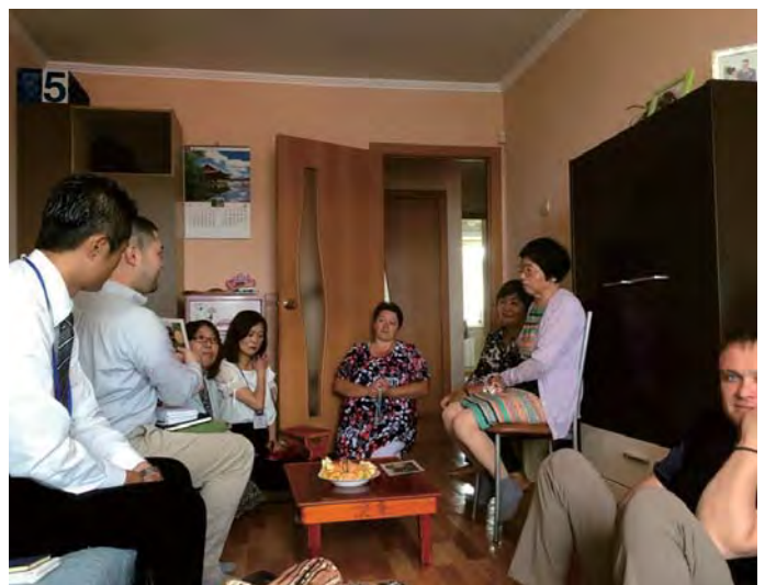
Сахалины гишүүдтэй хамтдаа тэдорид явснаар харилцаа нь улам бэхжэв.

Шүнийн багш маань хариуцсан А хэсгийн ахлагчтай нүүр тулж, сайн ажилласан шиг би ч гэсэн салбарын гишүүдтэйгээ хамтдаа гэгээлэг, эелдэг, халуун дулаан номын андууд болохыг, өөрийн зүрх сэтгэлээ сайжруулахыг хичээнэ. Хойшид хариуцсан салбарын гишүүдээ, элсүүлсэн гишүүнийхээ сайн багш нь болгохын төлөө зорилго тавьж ажиллах болно.