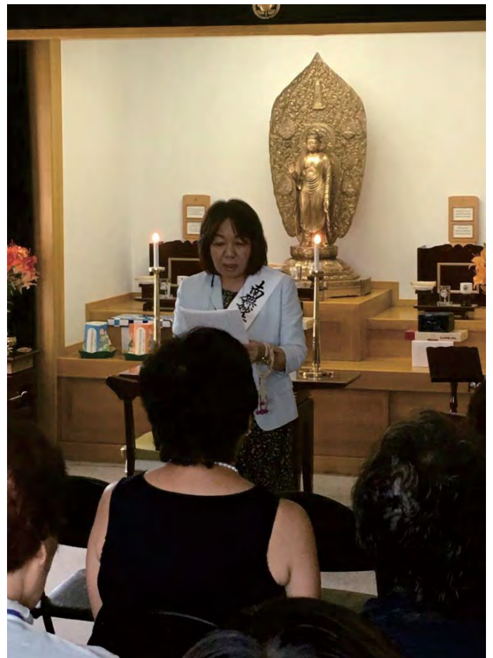
Сахалины өргөөнд илтгэл тавьж буй Цүбоүчи ахлагч

Том охин маань 3 нас хүрдэг жилээ дунд чихний үрэвсэл болчихов. Би охиныхоо өвчний