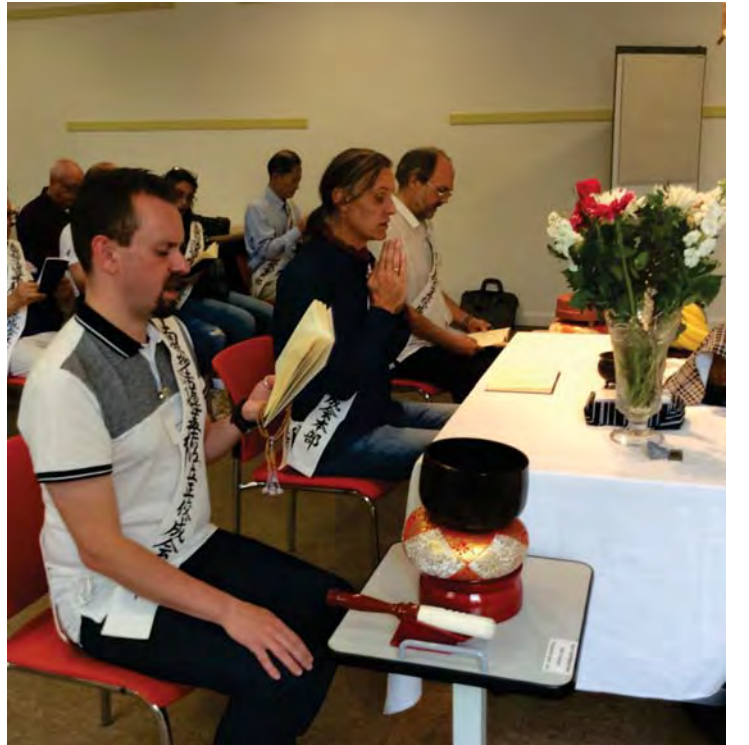
सुत्रपाठमा सहलिडर हुँदै गोड अघी स्टाफजि

म यो धर्मलाई फैलाउने छु र मेरो सपना छ कि एकदिन वेल्समा पनि संघ होस भनेर ।