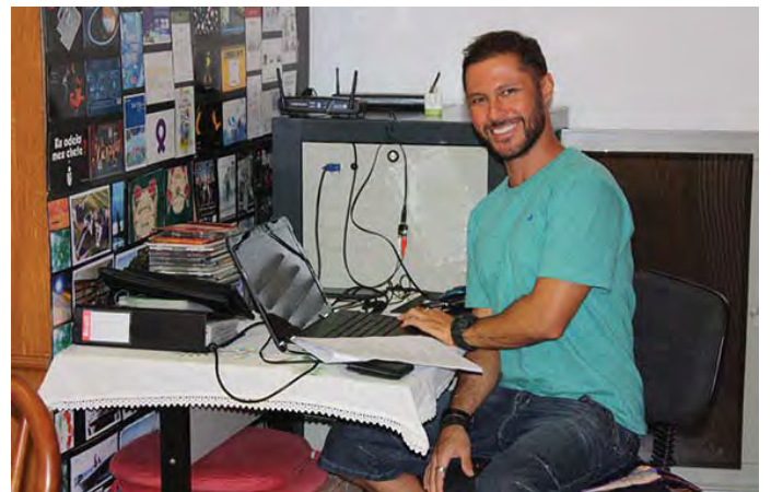
ब्राजिल मन्दिरमा बुद्ध धर्म सेमिनारमा श्रव्यदृश्यको काम गर्दै

बुद्ध धन्यवाद, संस्थापक धन्यवाद, अध्यक्ष धन्यवाद, सबैजना धन्यवाद ।