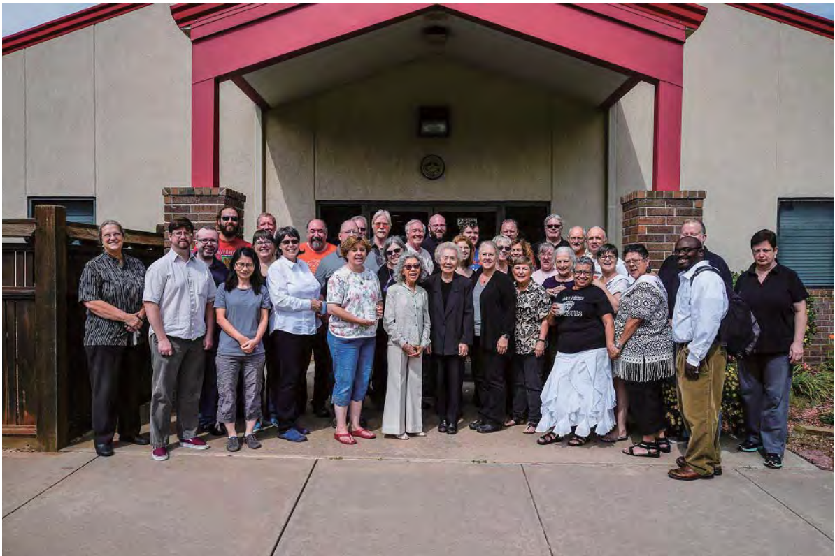
Các thành viên của trung tâm Dharma Oklahoma và San Antonio sau buổi tập huấn cuối tuần được tổ chức tại Trung tâm Dharma của Oklahoma vào năm 2016.