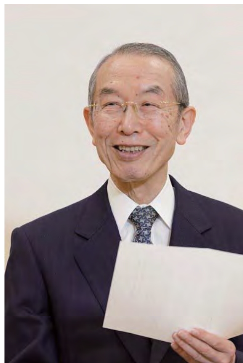
Рисшо Косей Кай, Ерөнхийлөгч Нивано Ничикоо