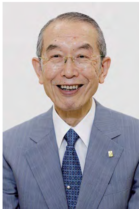
Рисшо Косей Кай, Ерөнхийлөгч Нивано Ничикоо