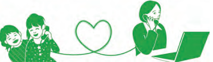
පිලිතුරු සැපයීම , තෝකියෝ පවුල් අධ්‍යාපන හා පර්යේෂණ ආයතනය

එක් උණුසුම් වචනයක් මව විසින් නොපැවසුවත් , දරුවා තුල තනිකම වෙලාගෙන ඇති බව අමතක නොකරන්න. දරුවා පාළුවෙන් සිටිනා විට ' ඔයාට පාළු නේද..... එත් හැම දෙයක්ම දරාගෙන සිටිනවාට ස්තූතියි' යනුවෙන් පැවසීම වැදගත් වෙයි. එවැනි දේ තුළින් අම්මා මාව තේරුම්ගෙන සිටිනවා , යන සැහැල්ලුව දරුවාගේ සිතට ඇතුළු වේ.