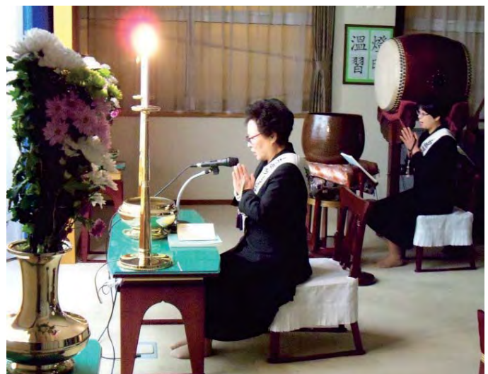
Хэсгийн ахлагч болсноосоо хойш судар голлон уншихдаа чадварлаг болсон.

Миний бие хойшид ч гэсэн олон хүнд энэхүү гайхалтай сургаалыг дамжуулж, хамтдаа аз жаргалтай болохын төлөө хичээх болно. Анхаарал тавин сонссон та бүхэнд баярлалаа.