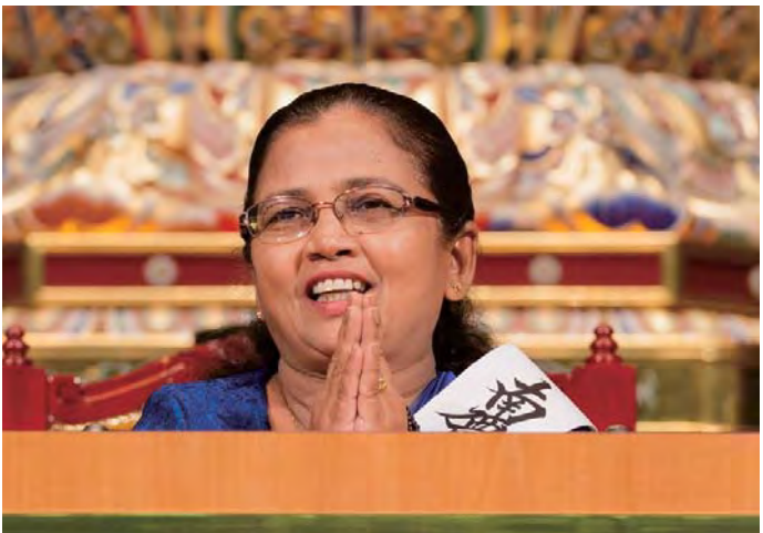
දැයිසෙයිඳෝවේදී සෙප්තෝව පවත්වන මාලි මිය.

ශ්‍රී ලංකාවේ සැදැහැවත් තේරුවාදී බෞද්ධ දෙමාපියන්ගෙන් ඉපිද