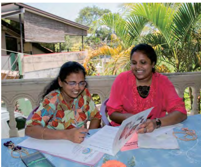
මාලි මිය හා නදීපා මිය පවුල් අධ්‍යාපන වැඩසටහන් පිලිබඳ සාකච්ඡා කරමින්